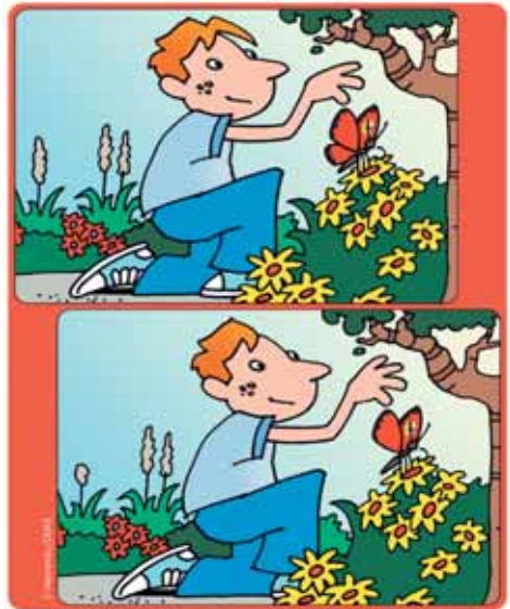
Finde die acht Fehler!