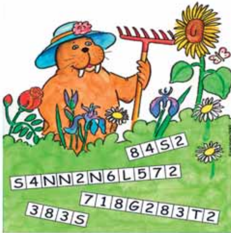
Lösung: ROSE, SONNENBLUME, MARGERITE, IRIS

Ersetze alle Ziffern durch die folgenden Buchstaben und du kennst Paulas Lieblingsblumen: 1 = A, 2 = E, 3 = I, 4 = O, 5 = U, 6 = B, 7 = M, 8 = R