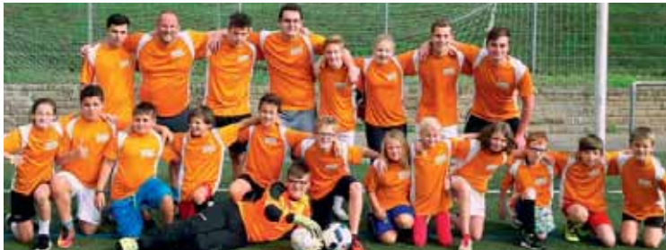
Auf dem Bild zu sehen sind die diesjährigen Mini-Kicker beim AKM-Turnier